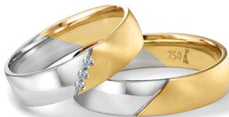
129 | 5.0 mm 0.030 ct