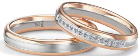
186 | 4.0 mm