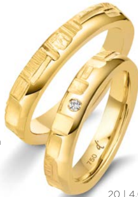
19 | 4.0 mm