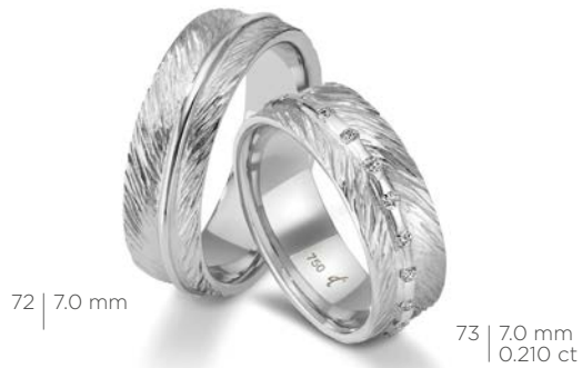
72 | 7.0 mm