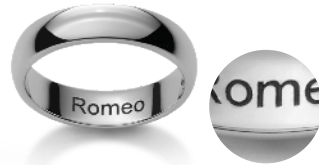
Blockschrift Caractères d'imprimerie