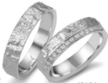
62 | 5.0 mm