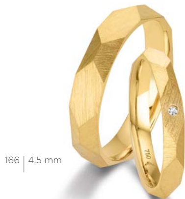
166 | 4.5 mm