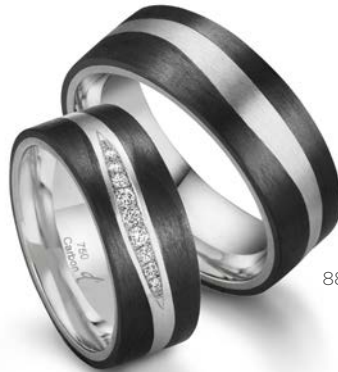
88 | 7.5 mm