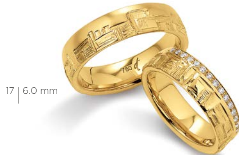
17 | 6.0 mm