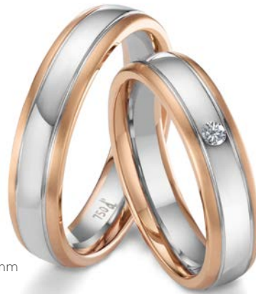
184 | 5.0 mm