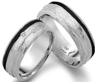
81 | 7.0 mm 0.055 ct