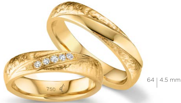
64 | 4.5 mm