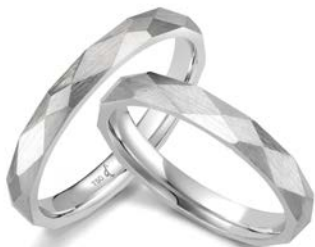
168 | 3.0 mm