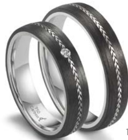
109 | 4.5 mm 0.030 ct