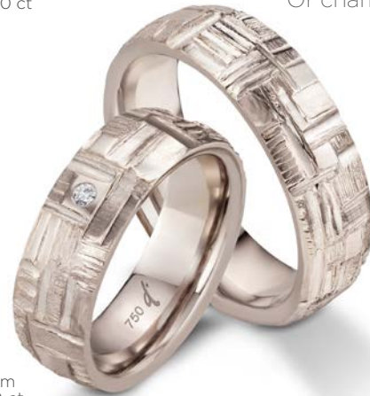
21 | 6.5 mm