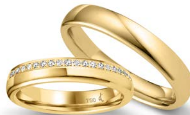
146 | 4.0 mm