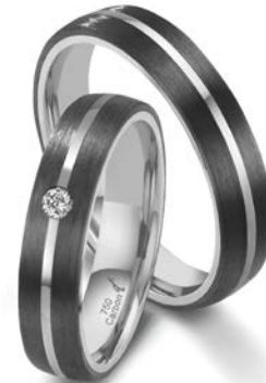
113 | 4.5 mm 0.030 ct