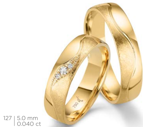
127 | 5.0 mm 0.040 ct