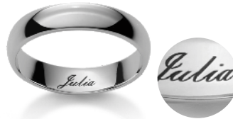
Schreibschrift Ecriture anglaise