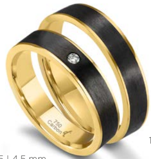
105 | 4.5 mm 0.030 ct