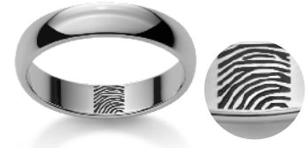
Fingerprint Empreinte digitale