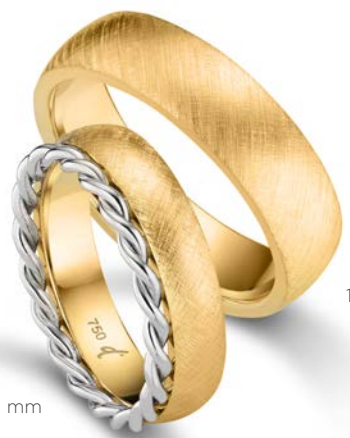
122 | 6.0 mm