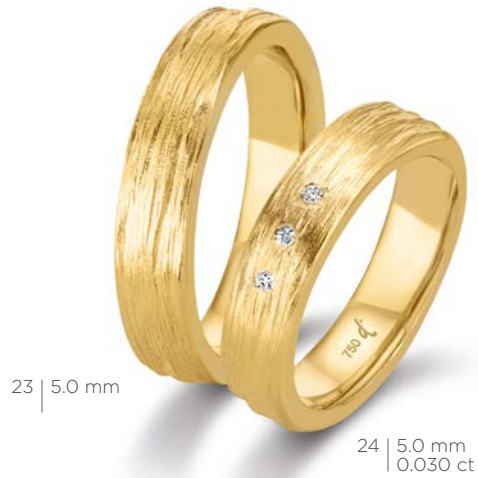
23 | 5.0 mm