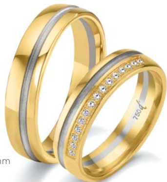
142 | 5.0 mm