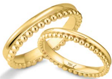
120 | 4.0 mm