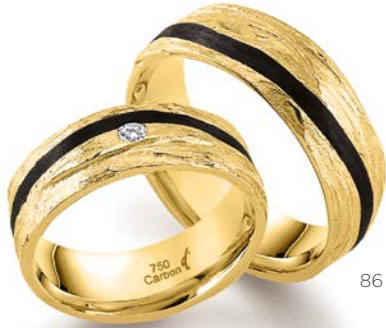
86 | 7.0 mm