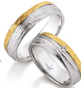
9 | 6.0 mm