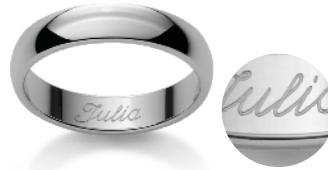
Schreibschrift Ecriture anglaise