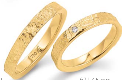
66 | 3.5 mm