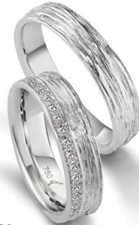
31 | 5.0 mm