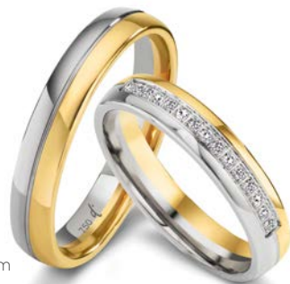
144 | 4.0 mm