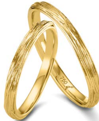
26 | 2.5 mm