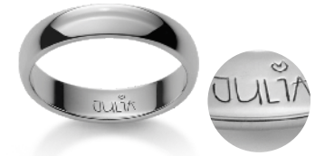
Ihre persönl. Handschrift Votre écriture personnelle