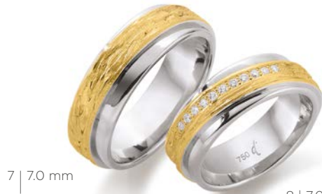
7 | 7.0 mm