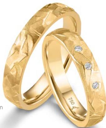
156 | 4.0 mm