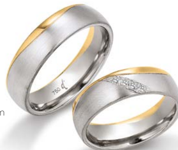
130 | 6.0 mm