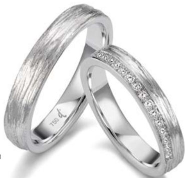
33 | 4.0 mm