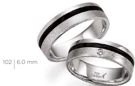
102 | 6.0 mm