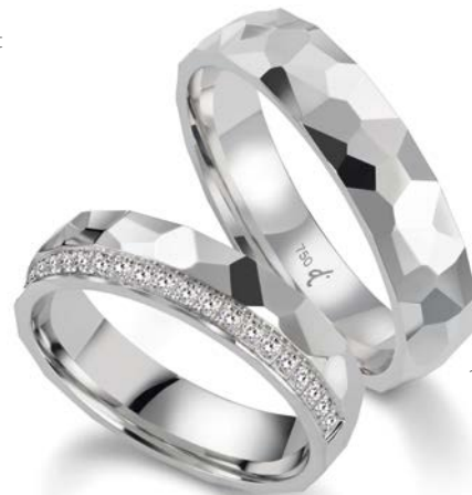
170 | 5.0 mm