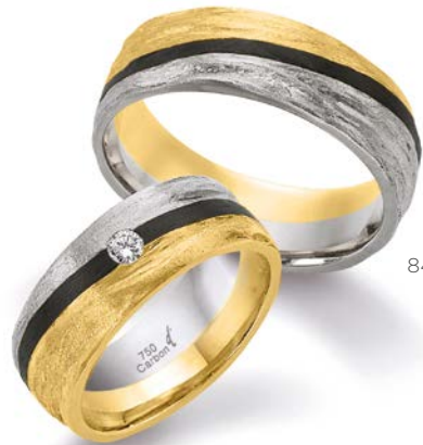
84 | 7.0 mm