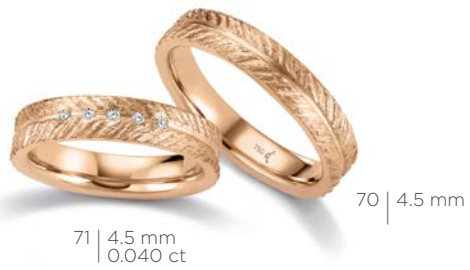
71 | 4.5 mm 0.040 ct