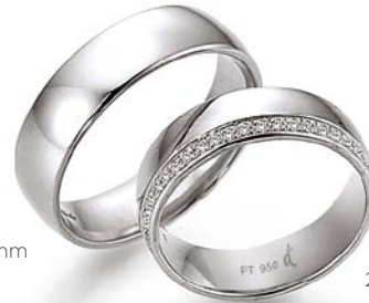
204 | 6.0 mm