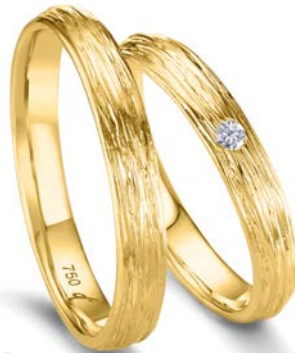
29 | 3.5 mm