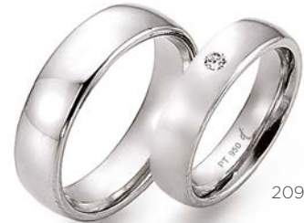
209 | 5.0 mm 0.030 ct