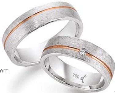
182 | 6.0 mm