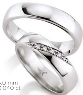
133 | 5.0 mm | 0.040 ct