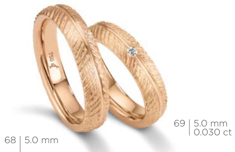
68 | 5.0 mm