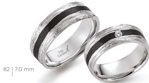
82 | 7.0 mm