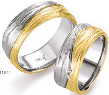
43 | 8.0 mm