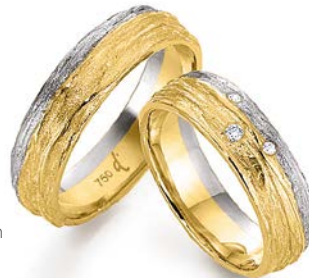
11 | 6.0 mm