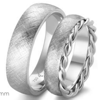
124 | 6.0 mm