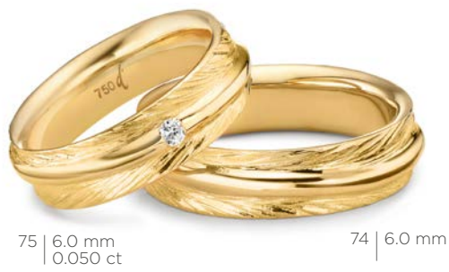
75 | 6.0 mm 0.050 ct