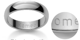
Blockschrift Caractères d'imprimerie