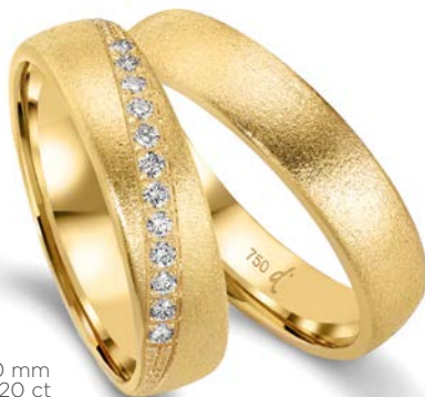
135 | 5.0 mm | 0.120 ct