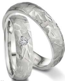
154 | 5.5 mm