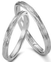
28 | 2.5 mm