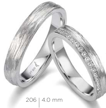
206 | 4.0 mm

Platin ist zäh, robust und höchst anspruchsvoll in der Verarbeitung. Platin, 30 Mal seltener als Gold, ist das kostbarste aller Edelmetalle. Sämtliche im Katalog vorgestellten Modelle werden auf Wunsch auch in Platin 950 gefertigt.