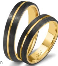
110 | 4.5 mm