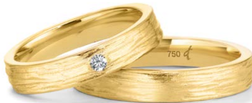
38 | 4.0 mm 0.040 ct