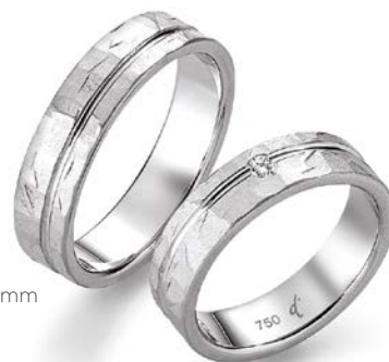
158 | 5.5 mm