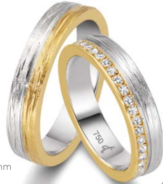
47 | 4.5 mm