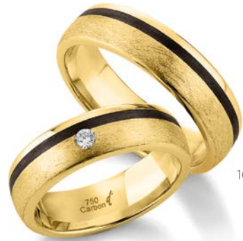
106 | 6.0 mm