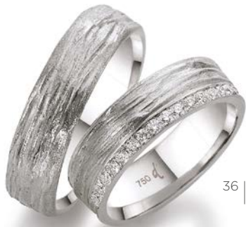
35 | 6.0 mm