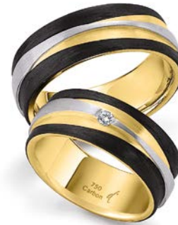
90 | 8.0 mm